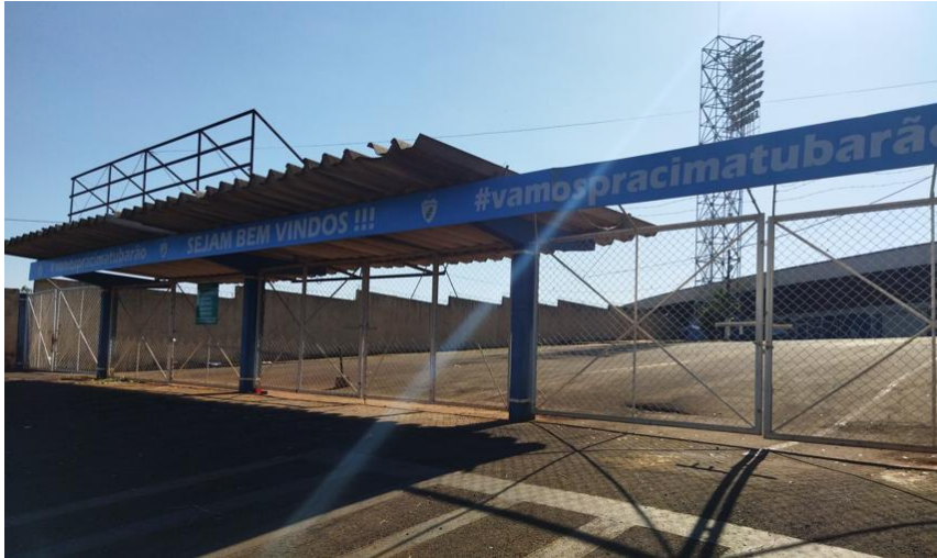
Figura 2 - Portão 1 Cadeiras Cativas e Arquibancadas

03 (três) acessos, sendo dois para torcida do time mandante e uma para a torcida do time visitante.