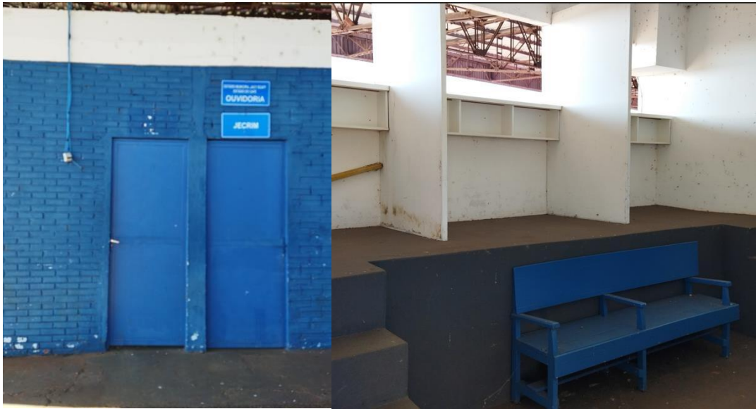
Figura 10 - Espaço Reservado ao JECRIM e Ouvidoria

Observação: Existe uma sala com a identificação, sem mobiliário e equipamentos adequados.