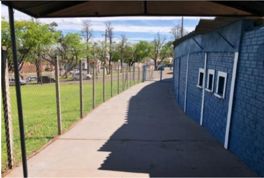
Figura 7 - Bilheteria Visitantes