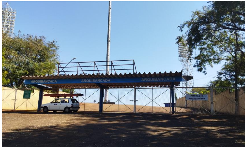
Figura 3 - Portão 2 Cadeiras Arquibancadas