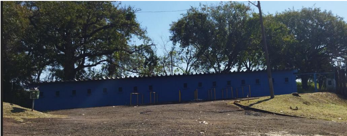
Figura 6 - Bilheteria Portão 2