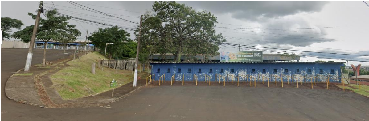
Figura 5 - Bilheteria Portão 1