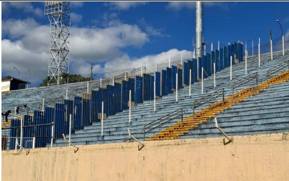
Figura 8 - Divisão de Torcidas Mandate e Visitantes

5.10. Quando moveis, as barreiras respeitam as vias de saída de emergência em relação à capacidade do setor?