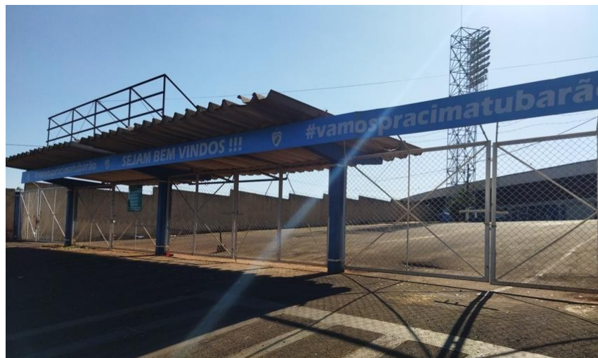
Figura 2 - Portão 1 Cadeiras Cativas e Arquibancadas

03 (três) acessos, sendo dois para torcida do time mandante e uma para a torcida do time visitante.