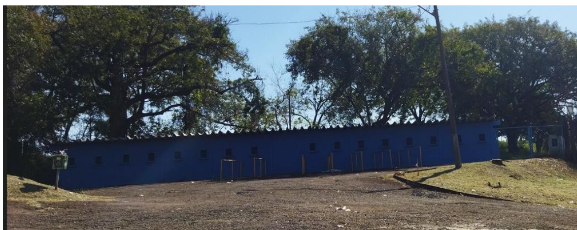
Figura 6 - Bilheteria Portão 2