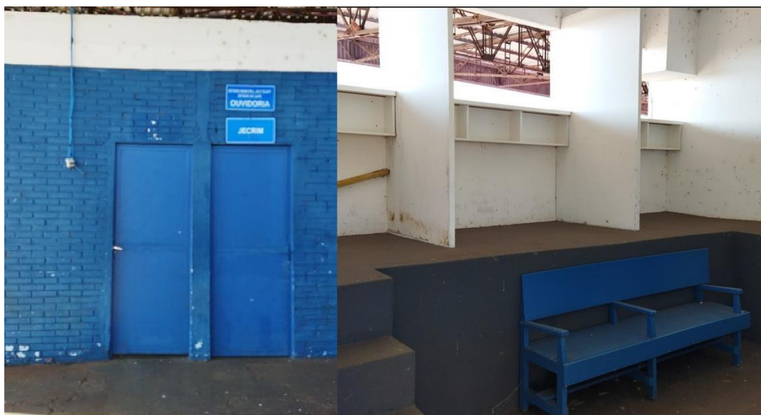
Figura 10 - Espaço Reservado ao JECRIM e Ouvidoria

Observação: Existe uma sala com a identificação, sem mobiliário e equipamentos adequados.