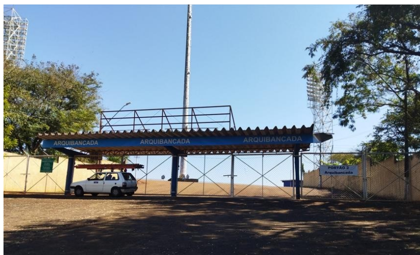
Figura 3 - Portão 2 Cadeiras Arquibancadas