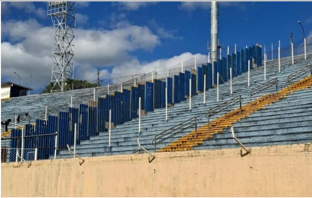
Figura 8 - Divisão de Torcidas Mandate e Visitantes

5.10. Quando moveis, as barreiras respeitam as vias de saída de emergência em relação à capacidade do setor?