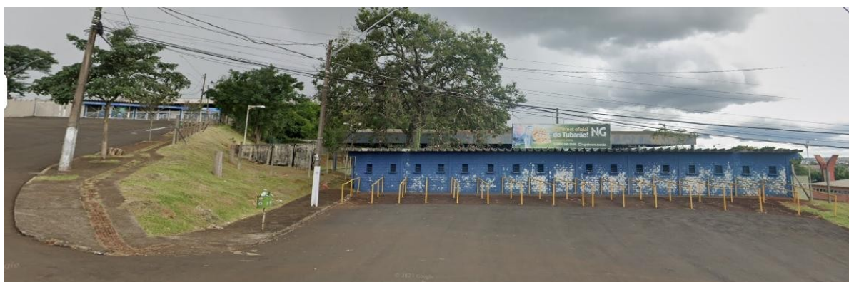
Figura 5 - Bilheteria Portão 1